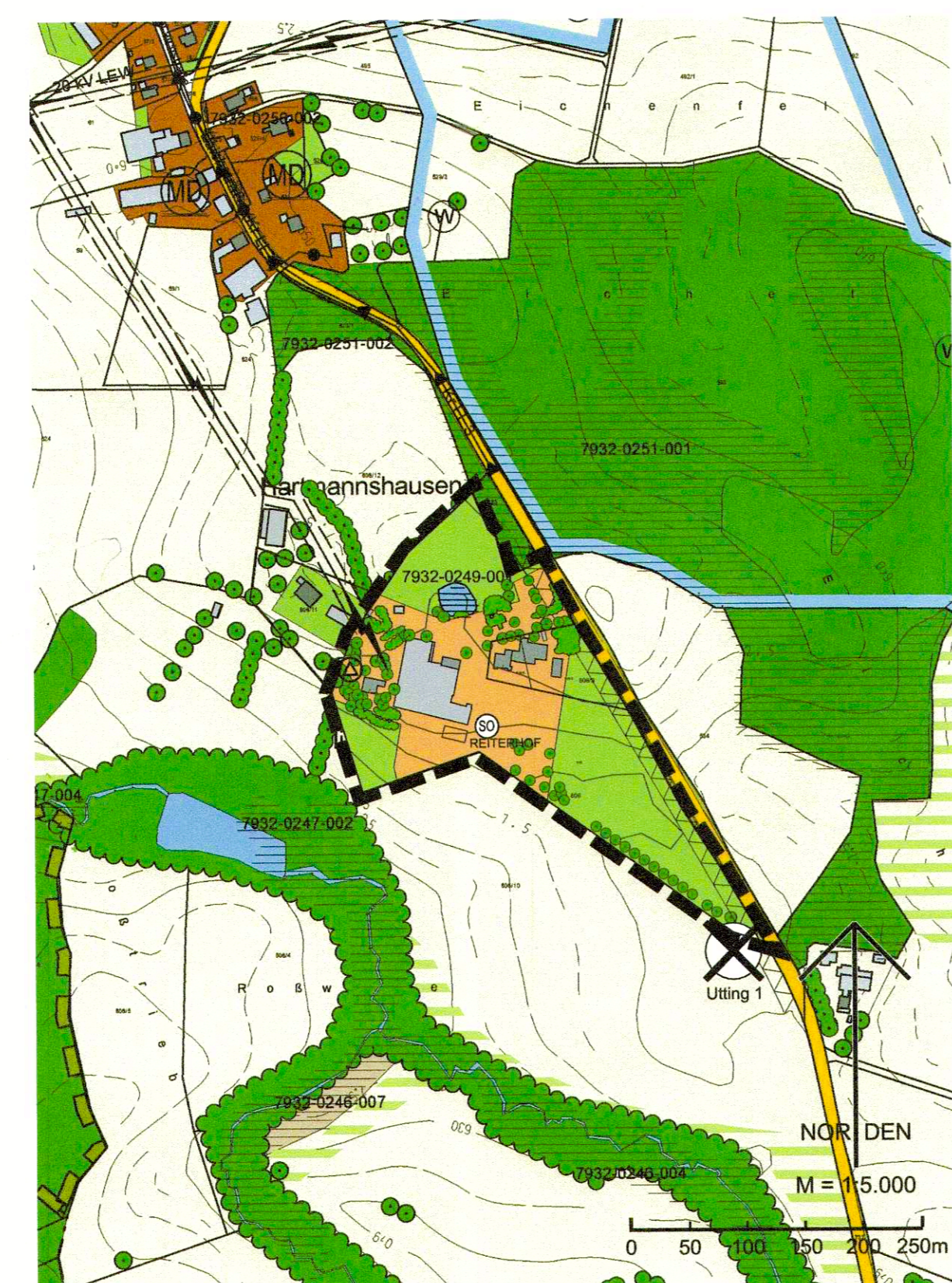
Finning neue Darstellung Flächennutzungsplan FNP 9. Änderung